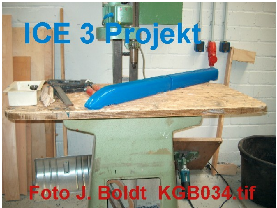
KGB034.tif