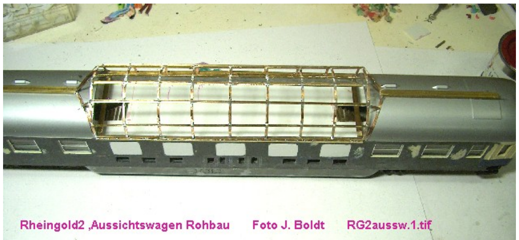
Rheingold2 ,Aussichtswagen Rohbau RG2aussw.1.tif